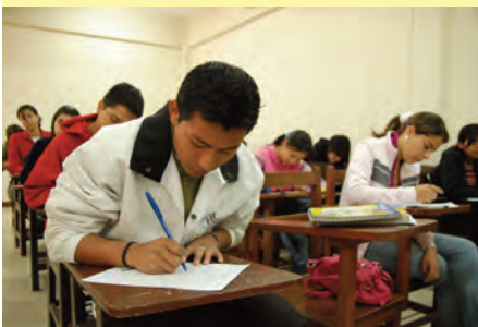
Estudiantes de Administración de Empresas directos beneficiarios de la jornada académica

La expectativa que generó la jornada académica del Departamento de Administración, Economía y Finanzas, el jueves 8 de mayo, desbordó la capacidad de Aula Magna del campus de la Ramón Rivero, confirmando la identificación plena de los