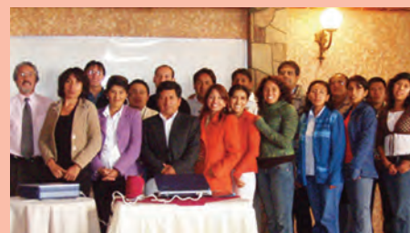
Estudiantes y profesionales que asistieron a la presentación del proyecto.

Luego de un año de diversas pruebas podrá implementarse este importante proyecto, que beneficiará no sólo al sector de la construcción, sino al medioambiente y, por ende, a la sociedad en su conjunto.