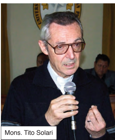
Mons. Tito Solari

El Arzobispo de la Arquidiócesis de Cochabamba, Mons. Tito Solari, nos honró con su presencia en la Reunión General de Docentes, que se realizó el sábado 31 de enero.