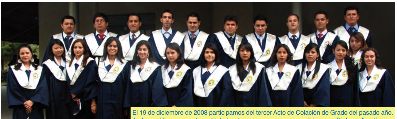
El 19 de diciembre de 2008 participamos del tercer Acto de Colación de Grado del pasado año. Ambas gráficas presentan a titulados de varias carreras que recibieron su Diploma Académico.