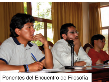
Ponentes del Encuentro de Filosofía

Del 6 al 8 de noviembre de 2008, estudiantes de la Facultad de Filosofía de la UCB recibieron a sus colegas de la Universidad Mayor de San Andrés (La Paz), en interesantes jornadas del área que se desarrollaron en el Aula Magna del campus Ramón Rivero, bajo el rótulo de “Filosofía, Política y Ética”.