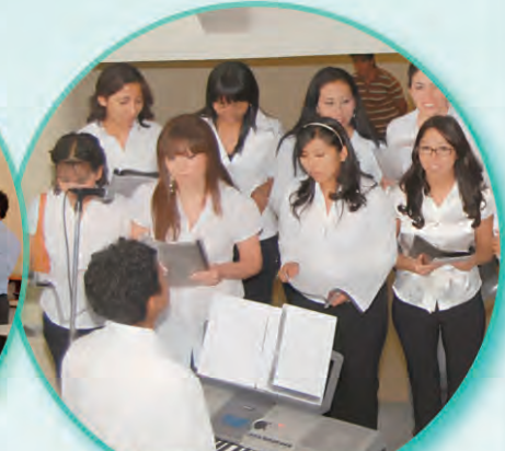
El coro de la Unidad de Idiomas en el momento de su presentación