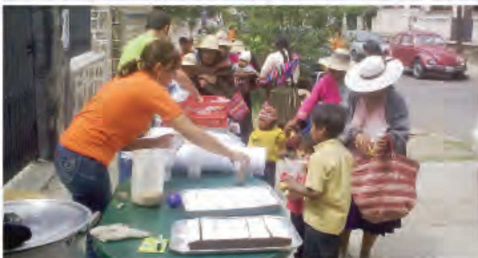
Estudiantes de Derecho repartiendo el desayuno navideño a niños de escasos recursos

Estudiantes de la carrera de Derecho de nuestra universidad realizaron un desayuno navideño el pasado mes de diciembre. Los beneficiarios fueron los niños de escasos recursos de la ciudad, que disfrutaron el tradicional chocolate