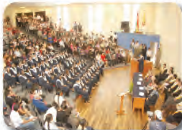
Vista de perfil del moderno auditorio durante el tercer Acto de Colación de grado de 2009

El tercer Acto de Colación de Grado de 2009, fue la perfecta ocasión para estrenar el moderno auditorio del campus Tupuraya.