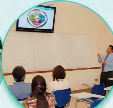
Docente realiza su conferencia con apoyo audiovisual