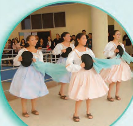
El Ballet folklórico de la UCB realiza una demostración

La comunidad universitaria está a la expectativa de la siguiente jornada que pretende instituirse cada semestre.