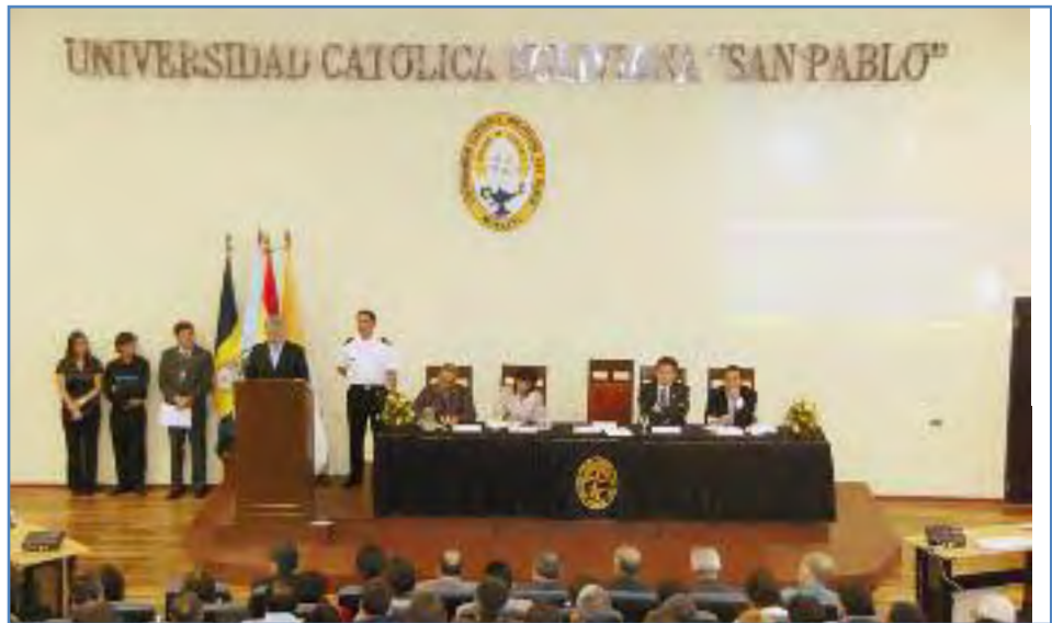
El Vicepresidente durante la conferencia

La UCB recibió en el campus Tupuraya al Lic. Álvaro García Linera el pasado 16 de septiembre. El Vicepresidente, expuso el Proyecto del Estado Plurinacional, sus dimensiones y el contexto en el que se erige en la coyuntura actual