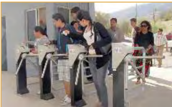
Estudiantes, docentes y administrativos ingresan a la Universidad a través del nuevo sistema de acceso electrónico

Nuestra Unidad Académica ha crecido vertiginosamente, el funcionamiento a plenitud del Edificio Multifuncional Académico en el campus Tupuraya lo demuestra.