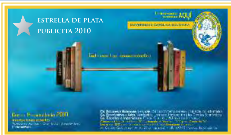
El arte de prensa ganador de la Estrella de Plata PUBLICITA 2010

La UCB Unidad Académica Regional Cochabamba y la agencia de publicidad i-estrategas, recibieron la prestigiosa “Estrella de Plata” un reconocimiento a la calidad creativa y comunicacional del arte de prensa denominado “Pesas” (foto), en el marco del Sexto Festival Nacional de Publicidad “PUBLICITA 2010”.