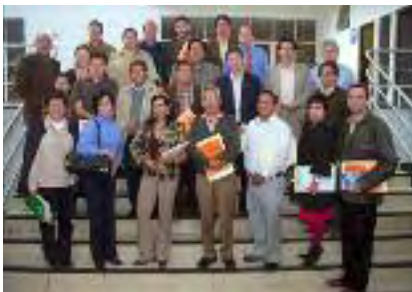
Los participantes del Seminario después de la capacitación

se iniciaron las actividades para el rediseño curricular de la ucb