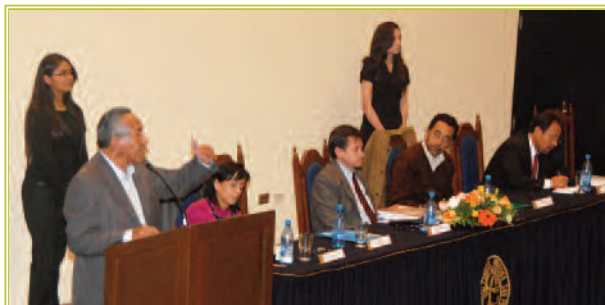
El Dr. Cárdenas durante la conferencia.

La UCB recibió en el Auditorio del Edificio Multifuncional al Dr. Víctor Hugo Cárdenas el pasado 12 de mayo. El ex Vicepresidente de Bolivia expuso su reflexión sobre el Proyecto del Estado Plurinacional y el cambio que significa a nivel político, social y cultural para los bolivianos.