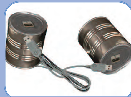
Detalle del afiche promocional del programa.

El éxito de la maestría en su modalidad presencial inspiró a los organizadores a realizar la primera versión virtual, para ampliar los resultados con profesionales del ámbito nacional e internacional.