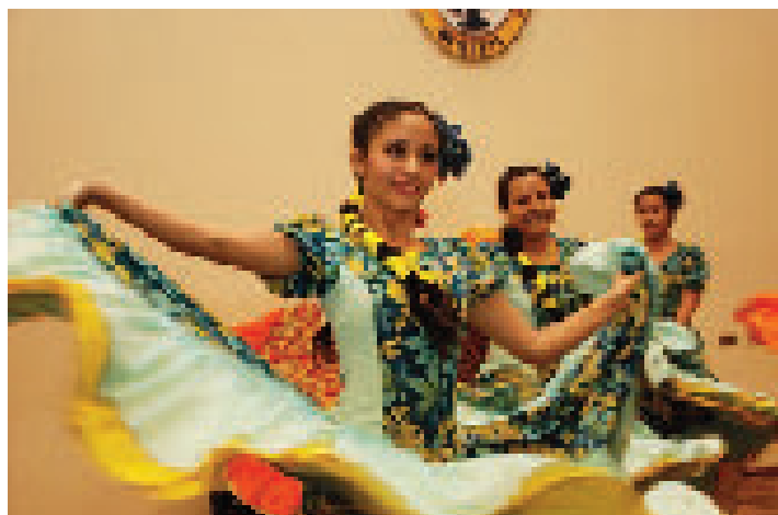
Ballet Folklorico UCB

Luego del espectáculo artístico, los agasajados compartieron un refrigerio, en los renovados ambientes de la terraza.