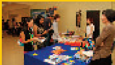
Stands de la Embajada de Italia y de la Secretaría de Becas de la Unión Europea.

La jornada concluyó con la exhibición de la película "Nacido en Absurdistán", en el marco del Ciclo de Cine Europeo.