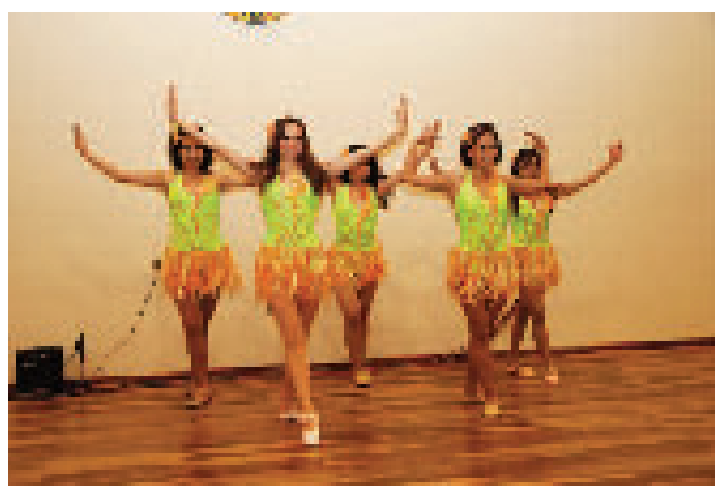
Ballet de danza moderna