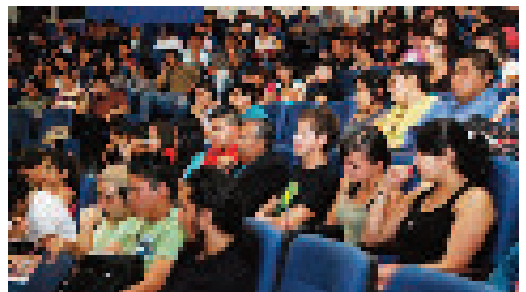
Estudiantes de distintas carreras asistieron a la Presentación de la Carta Pastoral.

Presentó a la Carta Pastoral como el producto de una consulta previa a los cristianos. Su objetivo es reavivar el compromiso y la esperanza de todos en la transformación de la realidad actual del país. La lectura de la carta nos invita a discernir el problema, su estudio, análisis, reflexión y luego solución.