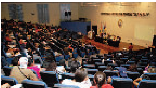
La juventud de la UCB respondió a la convocatoria.

Por su parte, el Padre Eugenio Coter reconoció que en Bolivia hay una diversidad de culturas, etnias, comunidades, pueblos, así como la singularidad y dignidad de cada ser humano. La Carta está en el fundamento de lo que une estas diversidades, sostuvo.