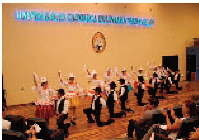
Ballet Folklorico UCB