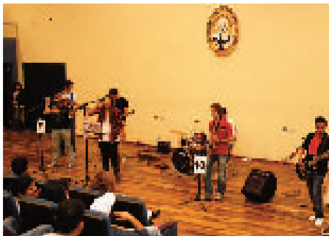
Ensamble orquestal Fuzión UCB

El coro estudiantil, formado a iniciativa de la Unidad de Idiomas, interpretó lo mejor de su repertorio. Y la tarqueada universitaria, conformada por estudiantes y personal administrativo, hizo vibrar al auditorio al ritmo de su tradicional “Cebadilla”.