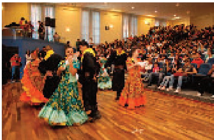
Ballet Folklórico UCB